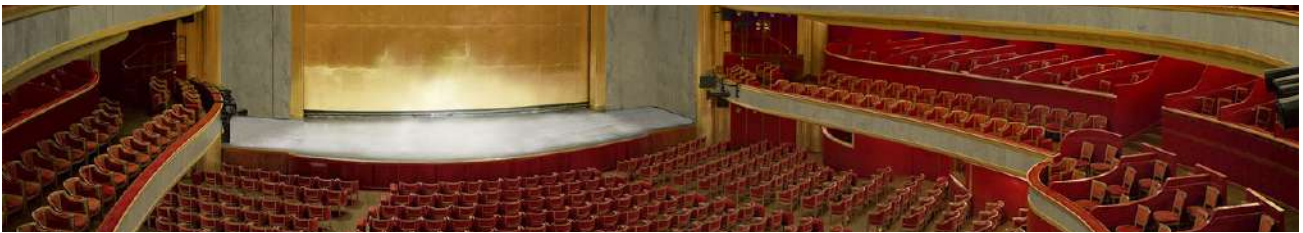
Théâtre des Champs-Élysées

Céleste Productions propose des formules tarifaires de groupe qui répondent à vos attentes pour des concerts de grande qualité. Ces concerts se déroulent au Théâtre des Champs-Élysées , à la Salle Gaveau ou à la Philharmonie de Paris .